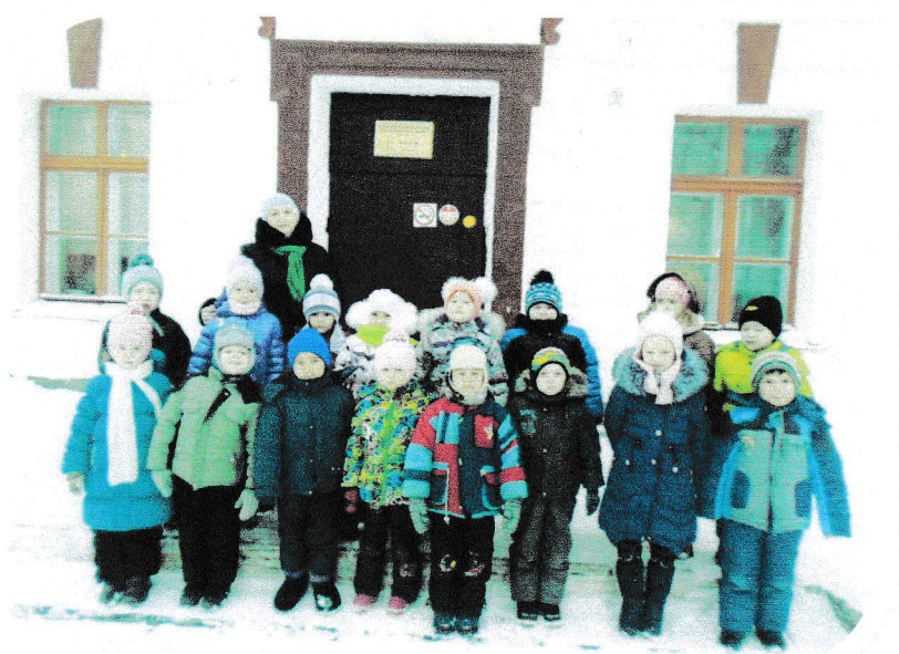
ФОТО ОТЧЁТ об экскурсии подготовительной группы в школу №12

Подготовили: воспитатели Вяткина Н.В., Клементьева Е.Е.