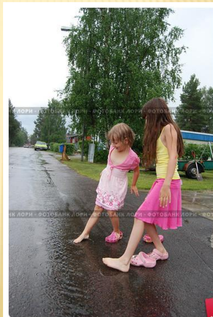
Дети играющие на дороге после дождя