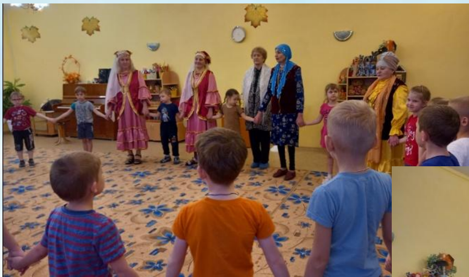
Встреча с представителями татаро-башкирского объединения «Якташлар»